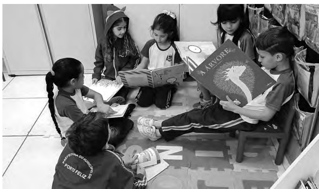
NA CORONEL ESMÉDIO. O 'Cantinho da Leitura' estimula o acesso aos livros