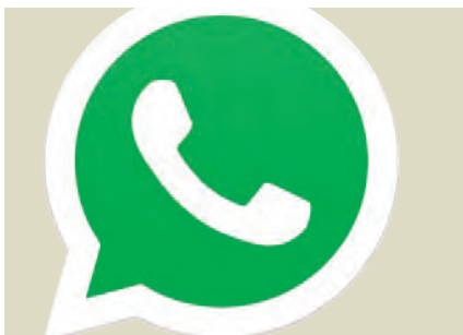
Mande sua foto por WhatsApp (15) 9.9805-97 40