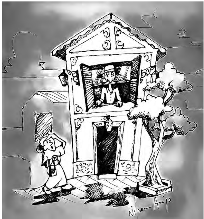
Ilustração do designer gráfico artista plástico Nilson Araújo

de que, costumeiramente, dia após dia e por mais de quatro anos, Vossa Excelência colocava a cabeça pelo espaço da janela para expiar a rua e voltava-se rapidamente para dentro. Pois bem! Por conta da criatividade popular isso lhe valeu o carinhoso apelido de CUCO!!!".