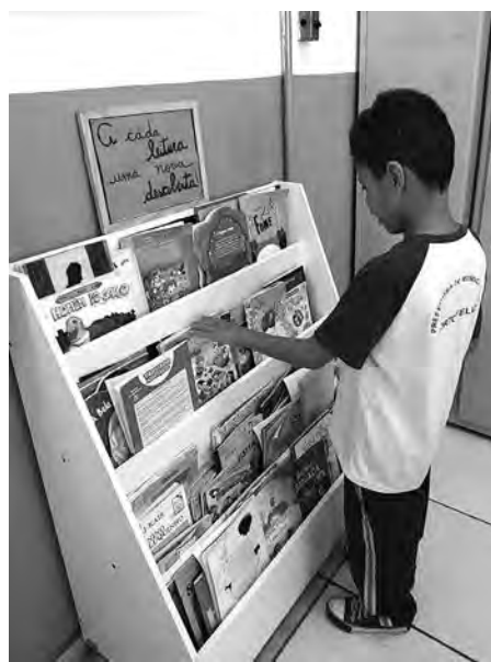
DESCOBERTAS. Os livros abrem novos horizontes para os pequenos leitores