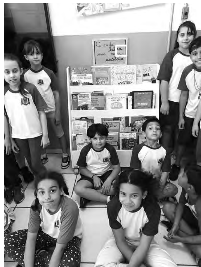
AMIGOS. A leitura estimula a criação de vínculos

A leitura é mais do que uma atividade pedagógica. Ela fornece aos alunos ferramentas para a vida inteira. Por meio da leitura, as crianças desenvolvem a concentra-