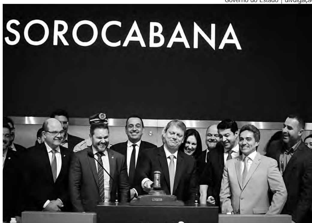
TARCÍSIO BATE O MARTELO. Na Bolsa de Valores, o governador anunciou a venda do lote da Rota Sorocabana para o Grupo CCR por 1,6 bilhão de reais

O negócio foi fechado sexta-feira 25, na Bolsa de Valores de São Paulo (B3), com um ágio de 267,8% em relação ao piso fixado pelo governo paulista. O início das obras está