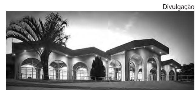
O LOCAL. Monteiro Lobato Espaço de Eventos

A planta também vai contar com fornecedores a apenas um quilômetro de distância, o que vai contribuir com as medidas sustentáveis. A proximidade otimiza o transporte e a logística, reduzindo a circulação de caminhões e o consumo de combustíveis, além de fortalecer o desenvolvimento local.