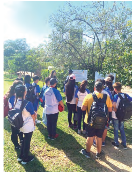
NO BAIRRO SOAMIM. Os alunos dos 7ºs anos da Coronel Esmédio visitaram o Mantenedor da Fauna Silvestre do Instituto Libio, onde estão cerca de 200 animais

ambiental é uma ferramenta de prevenção fundamental para a conscientização e sensibilização por meio de ações educativas permanentes", diz o instituto.