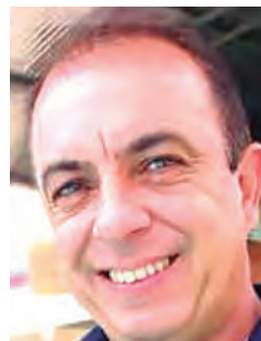
Na segunda-feira 25 aniversaria Nil