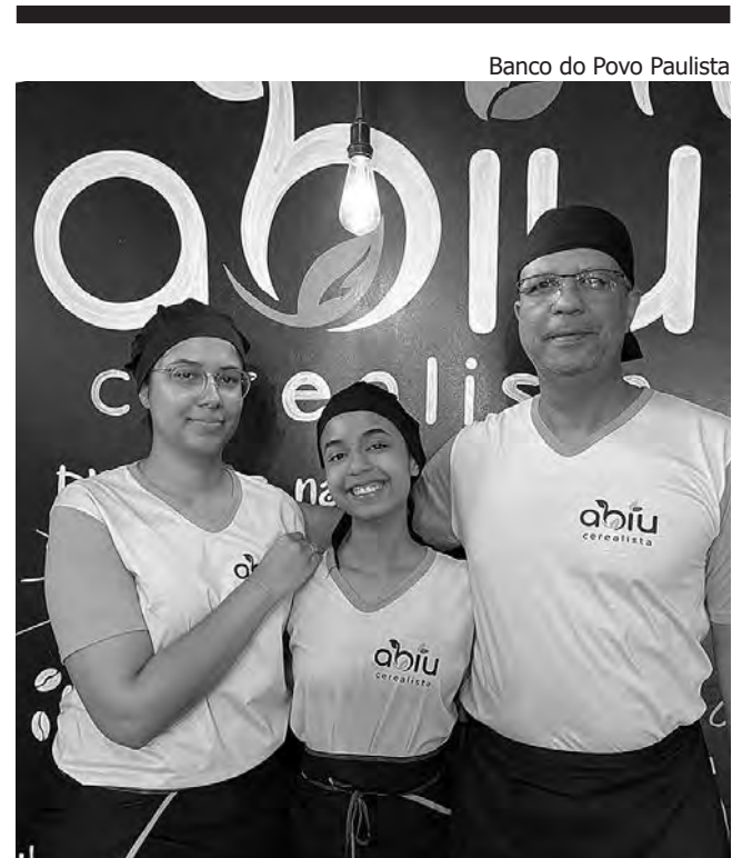
Banco do Povo Paulista

EMPREENDEDORES DE SUCESSO. Cerca de 40 empresários fizeram o curso de capacitação Empretec, um dos principais programas de formação de empreendedores do mundo. O curso foi desenvolvido pela Organização das Nações Unidas (ONU) e, no Brasil, é ministrado com exclusividade pelo Sebrae. São 60 horas de capacitação intensa, com atividades práticas que abordam os dez comportamentos que caracterizam os empreendedores de sucesso. A metodologia é totalmente vivencial e interativa, usando jogos, exercícios e debates. O Empretec foi realizado graças a uma parceria entre Sebrae de Porto Feliz e Prefeitura (por meio da Secretaria de Desenvolvimento Econômico).