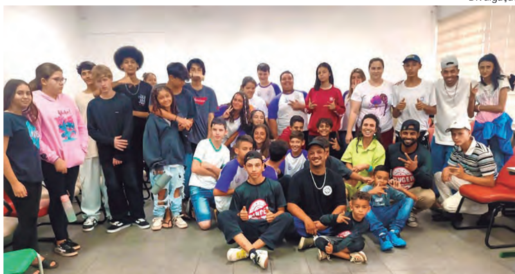
BATE-PAPO. O Circuito Paulista de Hip Hop iniciou a programação com os estudantes