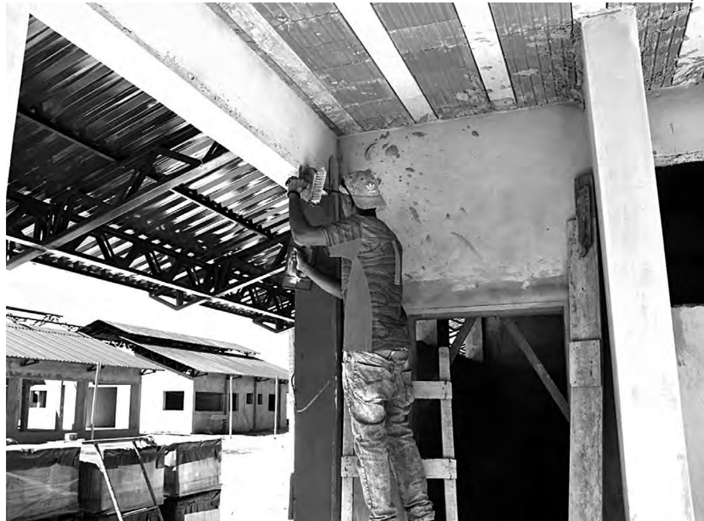
CONSTRUÇÃO AVANÇA. A escola de Altos do Jequitibá será a 2º em período integral do município