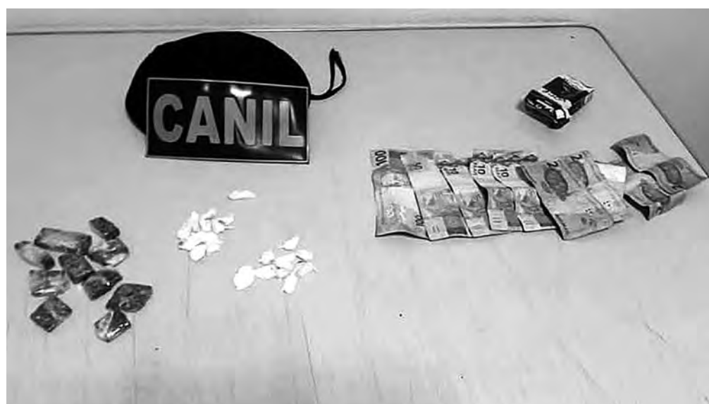
TUDO MEU. O suspeito, ao ser autuado, disse que as porções eram para seu uso

O sogro do atirador prontificou-se em pagar pelos danos, mas a vítima está se sentido ameaçada e, nesta semana, decidiu prestar queixa à Polícia Civil. O caso foi registrado como danos e ameaça, e será melhor apurado.