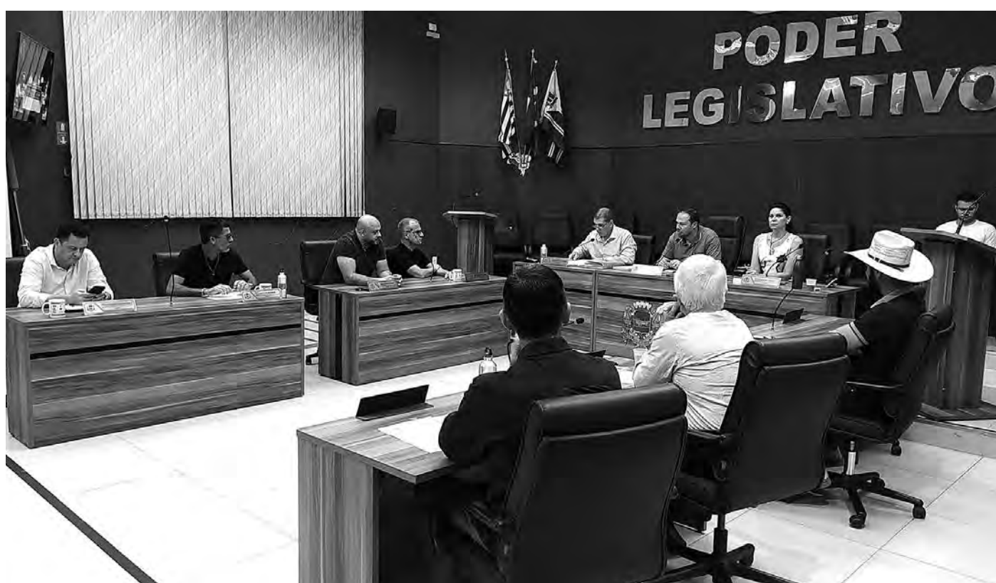
ORÇAMENTO APROVADO. Os vereadores têm direito a escolher onde R$ 361 mil serão aplicados no próximo ano

Márcio Yamamoto, jornalista e consultor político, especial para a TRIBUNA