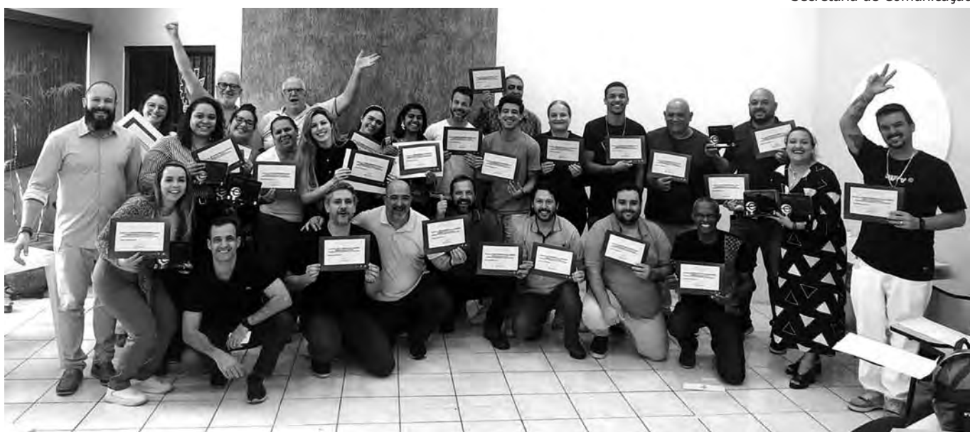
Secretaria de Comunicação

EMPREENDEDORES DE SUCESSO. Cerca de 40 empresários fizeram o curso de capacitação Empretec, um dos principais programas de formação de empreendedores do mundo. O curso foi desenvolvido pela Organização das Nações Unidas (ONU) e, no Brasil, é ministrado com exclusividade pelo Sebrae. São 60 horas de capacitação intensa, com atividades práticas que abordam os dez comportamentos que caracterizam os empreendedores de sucesso. A metodologia é totalmente vivencial e interativa, usando jogos, exercícios e debates. O Empretec foi realizado graças a uma parceria entre Sebrae de Porto Feliz e Prefeitura (por meio da Secretaria de Desenvolvimento Econômico).