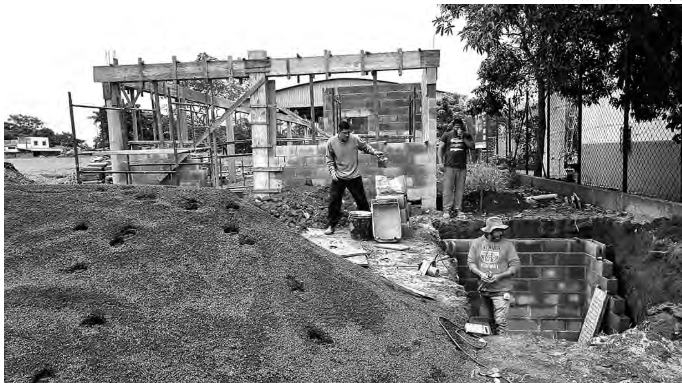
Secretaria de Comunicação