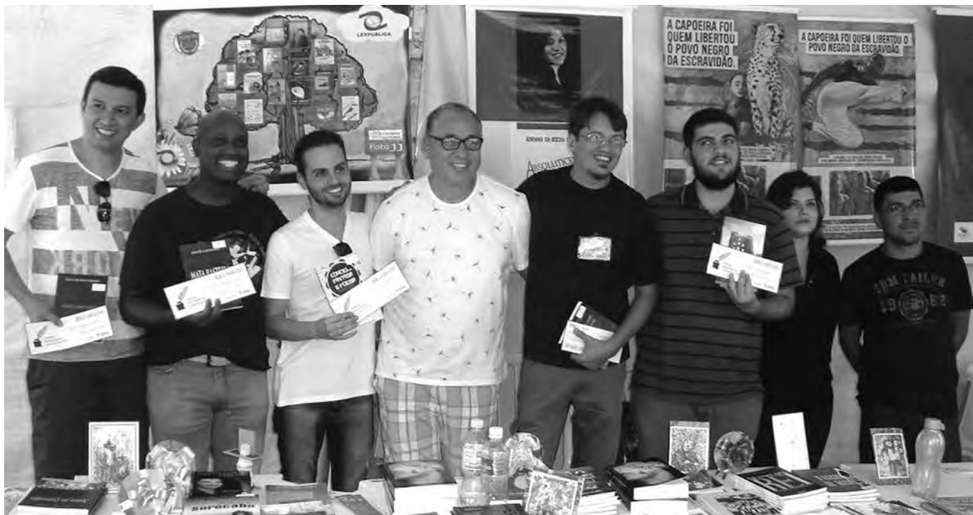
AÇÃO COLETIVA. Os próprios autores organizam e dirigem o evento, que começa na sexta-feira 13 no Sesc

O ator e diretor Paulo Betti, que lançará livro, é uma das atrações da Flaus