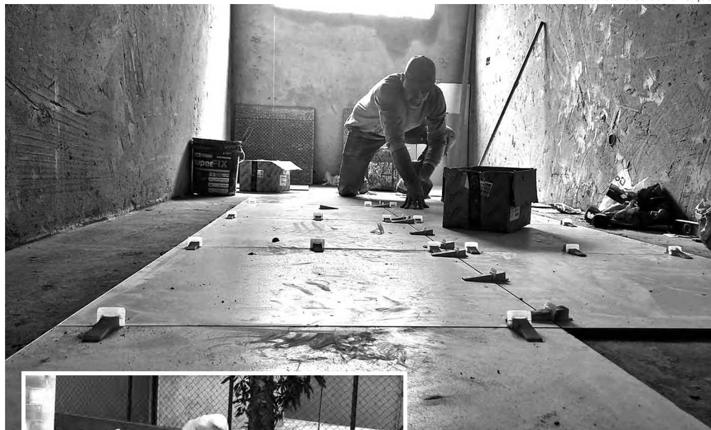
Secretaria de Comunicação