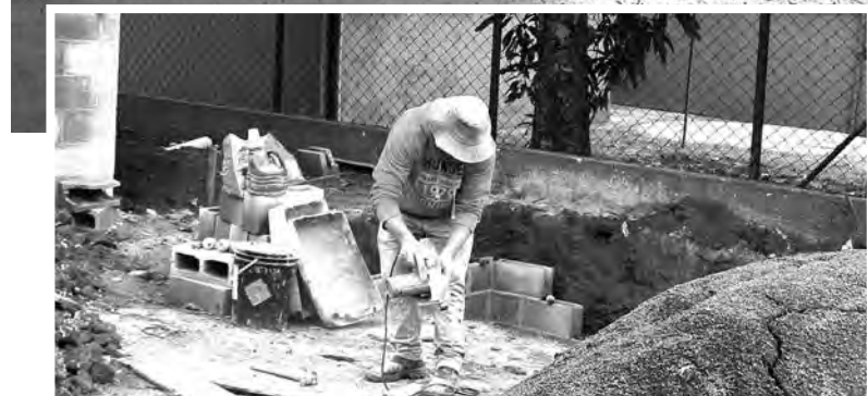
NOVA CRECHE. O trabalho de construção da creche na Agrovilva CAIC avança com serviços sendo executados dentro e fora do prédio; a Prefeitura quer terminar a obra no início do próximo ano