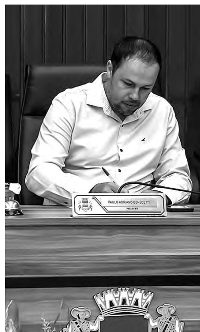
O presidente da Câmara elogiou os homenageados