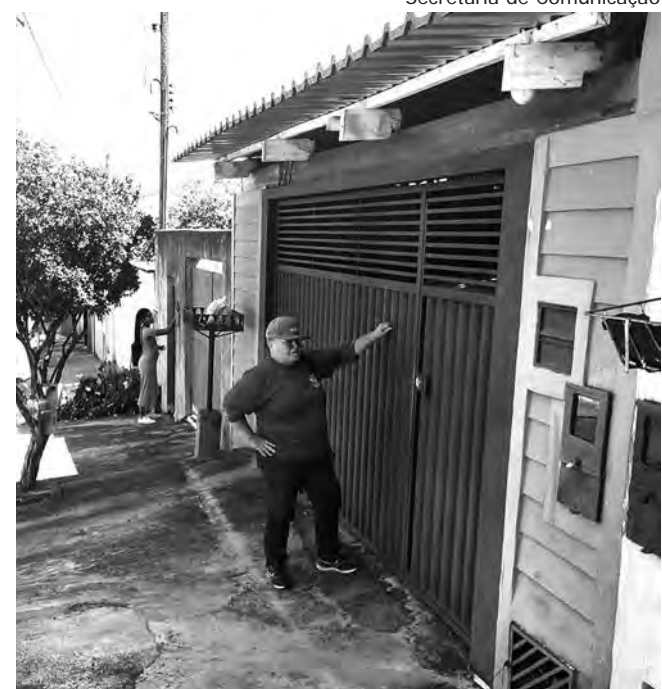
DE PORTA EM PORTA. As equipes lembraram aos moradores de vários bairros os cuidados necessários