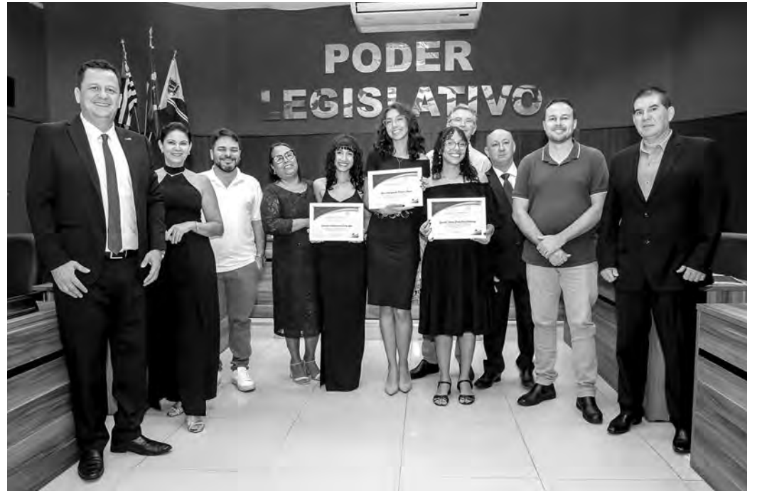
APLAUSO ÀS FUTURAS CIENTISTAS. Alunas da Etec foram homenageadas na sessão