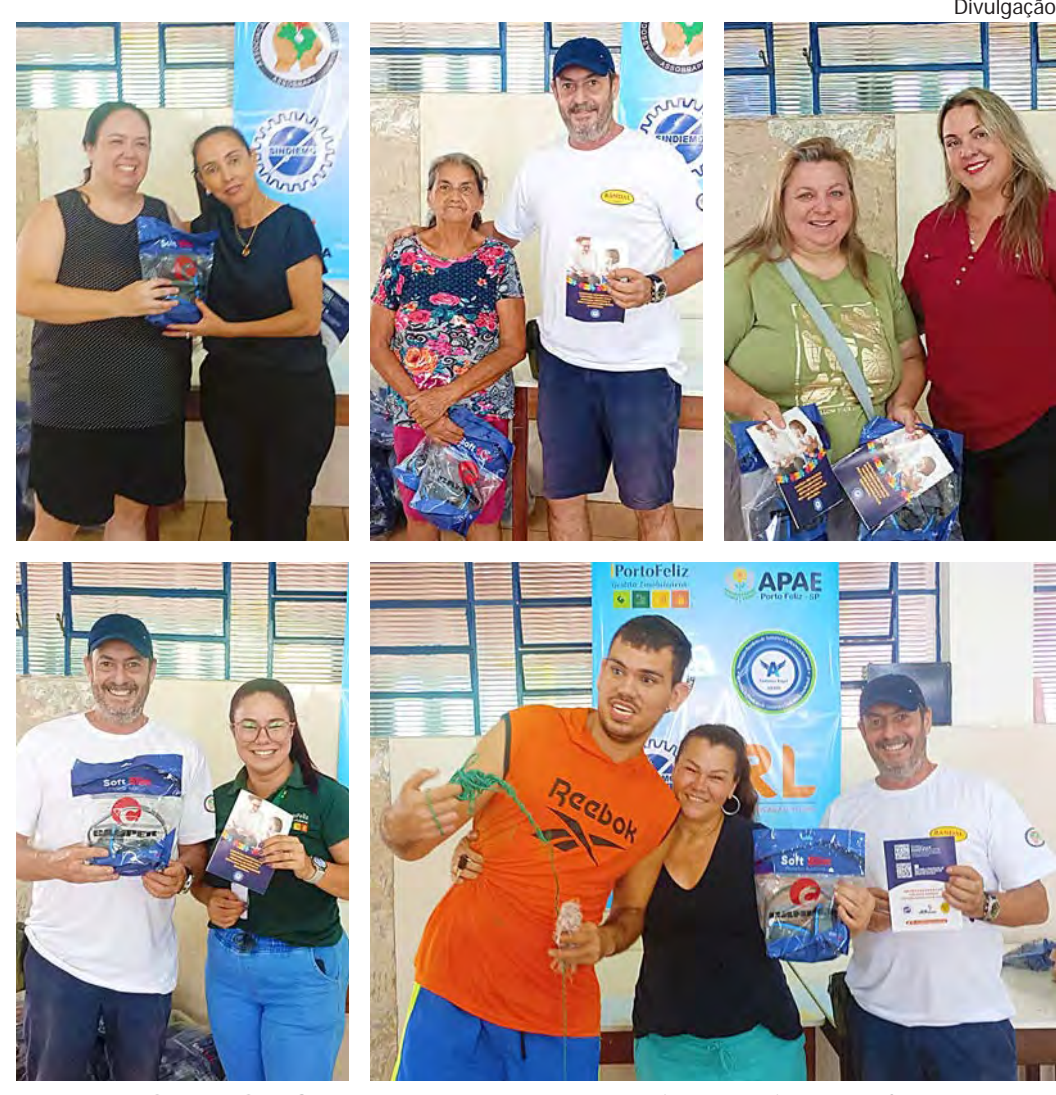
AJUDANDO A PROTEGER. Pessoas com TEA são mais sensíveis aos ruídos

Na APAE A entrega dos abafadores ocorreu na Associação de Pais e Amigos dos Excepcionais de Porto Feliz (APAE) no final de dezembro, antes das festas. O equipamento protegeu as pessoas contempladas contra o barulho das comemorações. Os ruídos causam grandes transtornos, incômodos e estresse às pessoas com Transtorno do Espectro Autista e idosos. Os protetores auriculares evitam isso de uma maneira muito eficiente e bastante confortável para o usuário.