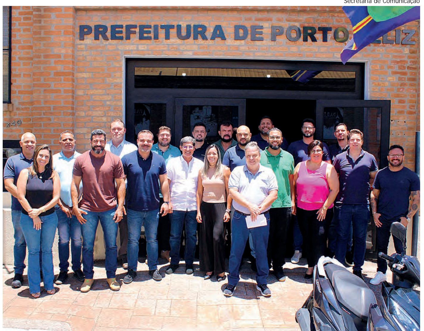
O secretariado do prefeito Célio Peixoto é uma mescla de nomes do governo do Dr. Cássio com gente nova e mudanças de pastas no primeiro escalão. O ex-prefeito também vai participar do governo, como informa a reportagem nesta edição | Página 4