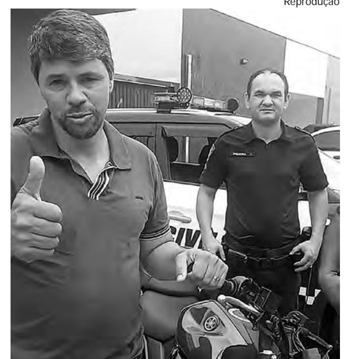
VÍTIMA AGRADECE. Recebeu a moto de volta