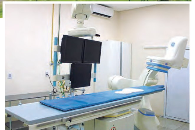
MAIS DUAS CONQUISTAS NA SAÚDE. No alto, as novas instalações da Unidade Básica de Saúde Dr. Walter Castelucci, a maior e a mais moderna da cidade; na foto acima à direita o Centro de Hemodinâmica da Santa Casa, que passa a oferecer técnicas pouco invasivas de diagnóstico e tratamento para vários tipos de doenças