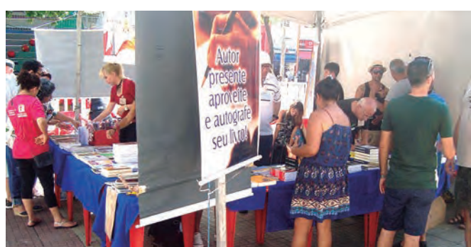
LIVROS NA PRAÇA. Esta edição da Flaus termina em grande estilo, com música e lançamento de livros

escritores e escritoras de várias localidades do Brasil e de países como Portugal e Angola.