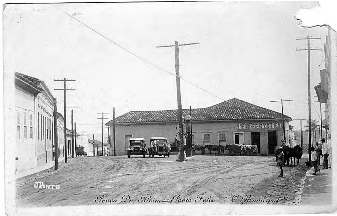
Praça Dr. Alvim - Porto Feliz - 'O Municipal'