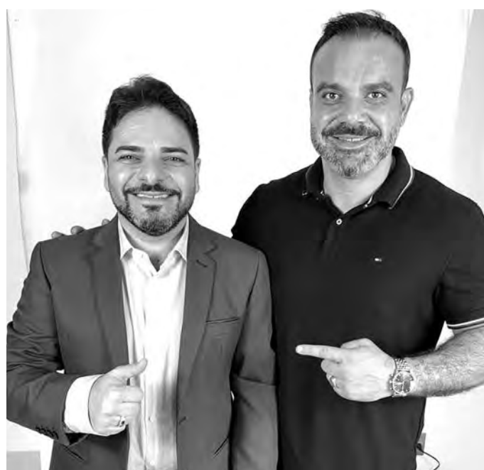
COM O PREFEITO CÉLIO PEIXOTO. ‘É preciso saber o momento de cobrar e o momento de elogiar’

É importante eu estar na escola também, porque ali observo muitas demandas. A escola recebe um público de diversas áreas, um público heterogêneo, que vem também da área rural e acaba se tornando um gabinete aberto, porque recebo as mais diversas demandas.