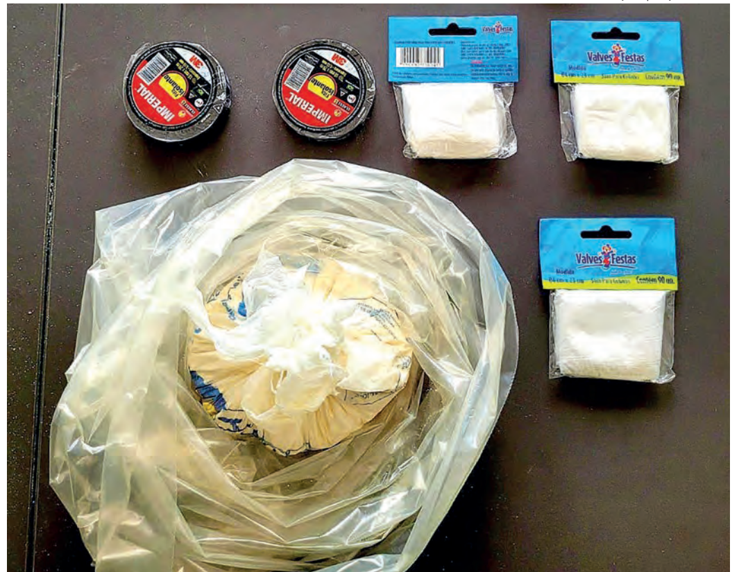
Guarda Civil Municipal | reprodução

Ex-detento do CPP trouxe a droga para a cidade usando um Uber | Página 3