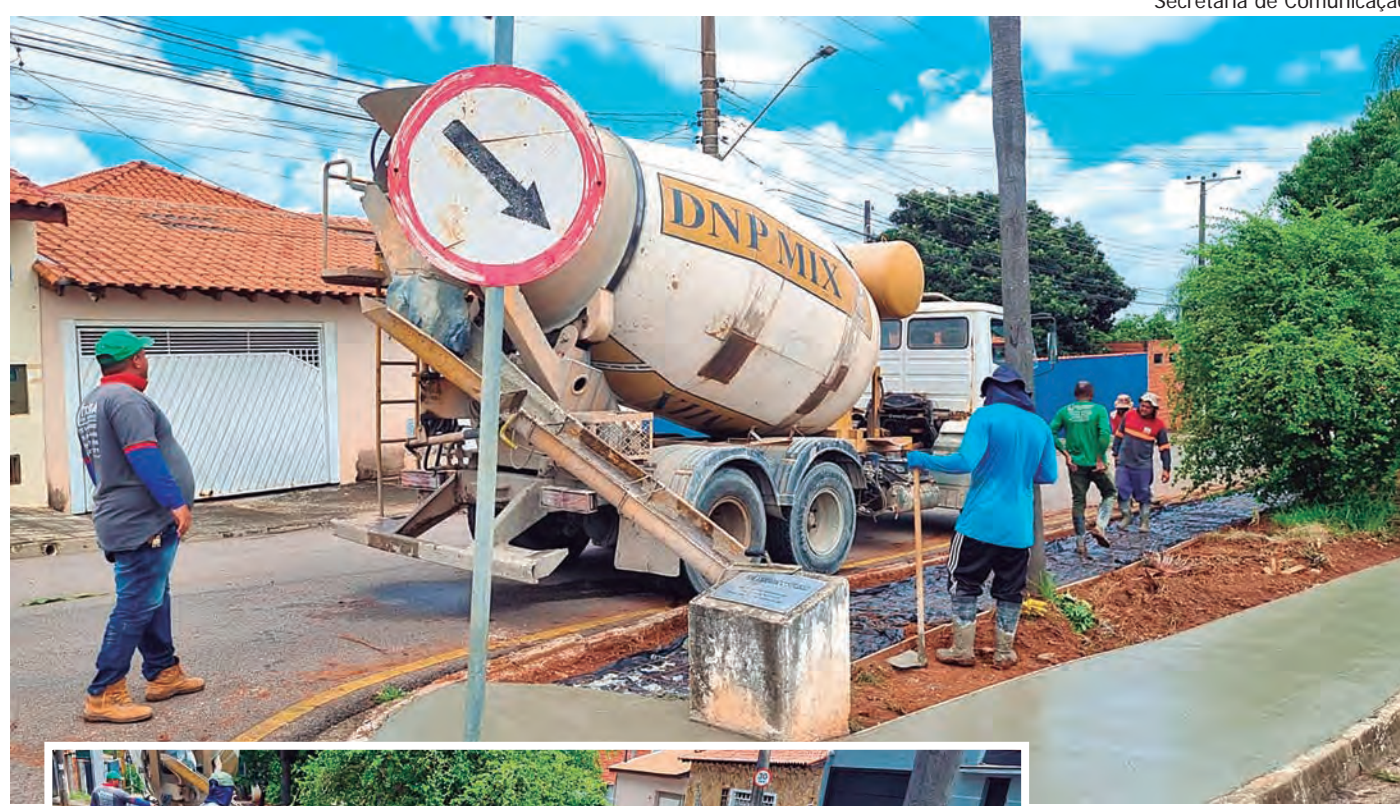
Secretaria de Comunicação