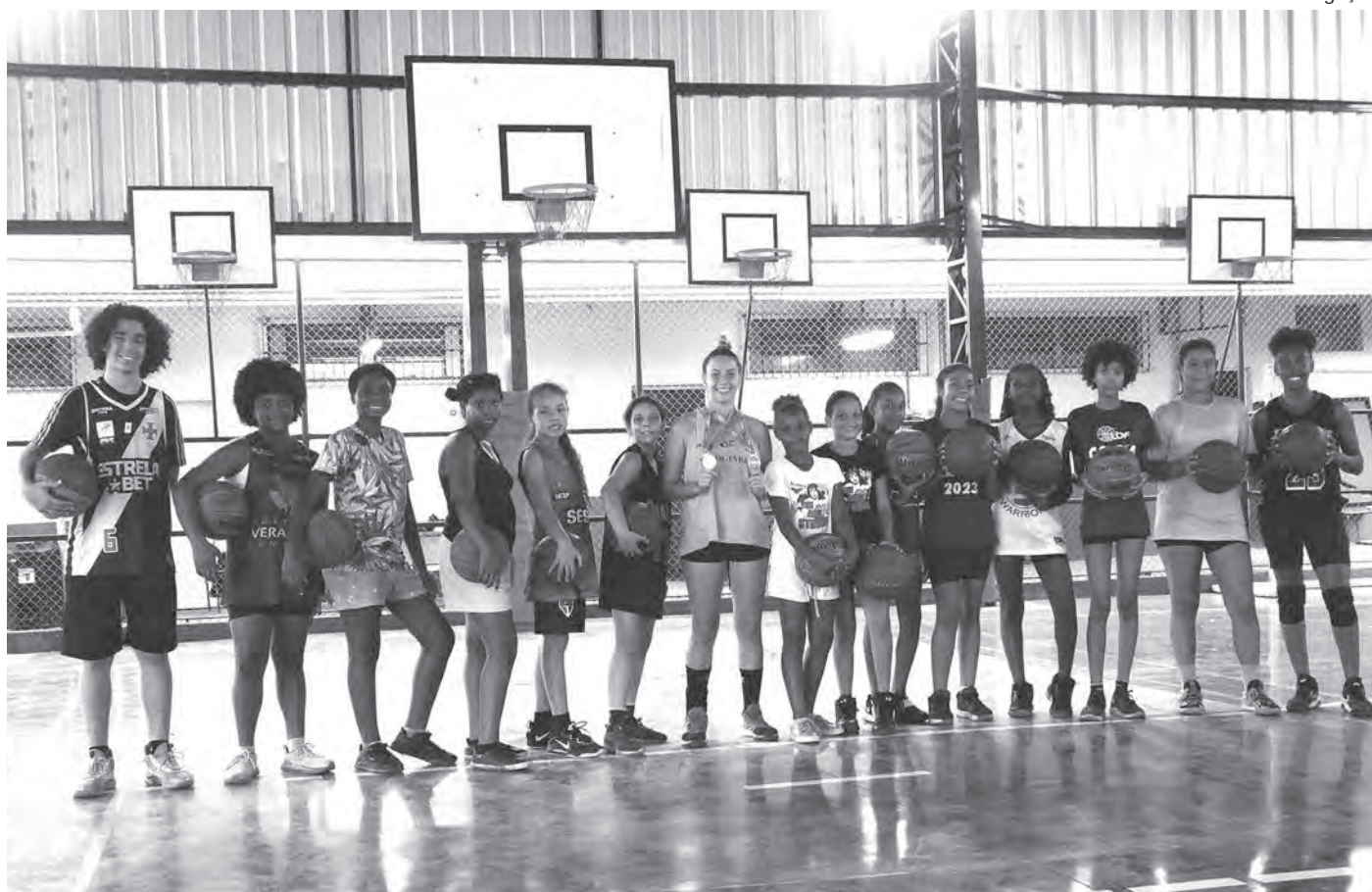
A CAMPEÃ NA QUADRA ONDE TUDO COMEÇOU. Ela deu dicas e incentivou as jovens jogadoras

A Coronel Esmédio fica na rua Adhemar de Barros 120 (Centro).